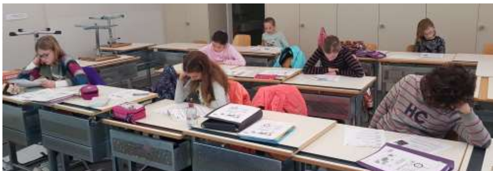
De leerlingen doen hun best op de toets Begrijpend Lezen