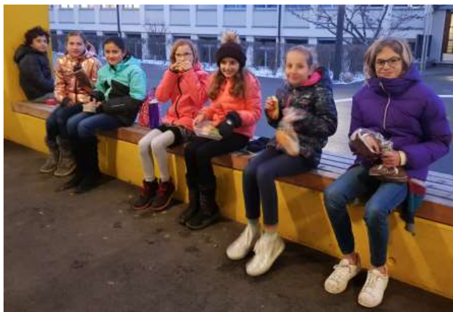
De leerlingen stampen met hun voeten om warm te blijven in de pauze