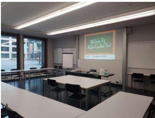
Dit is ons mooie lokaal in de Pädagogische Hochschule Zürich.

Op het moment dat deze foto werd gemaakt (na de les, om 21.04 uur om precies te zijn) was een deel van de groep al offline. We zijn normaal gesproken met 11 leerlingen!