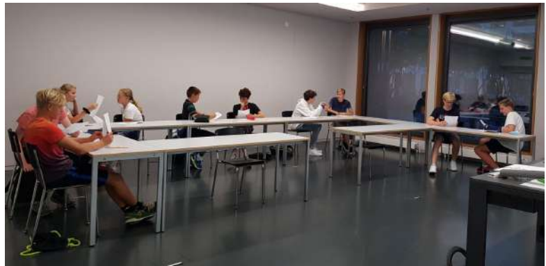
Hard aan het werk met een spreekoefening.

Elke les komt er een liedje aan bod (een bekend nummer uit de Nederlandse of Vlaamse muziekgeschiedenis). Tot nu toe hebben we al liedjes gehoord van Clouseau, Guus Meeuwis, Herman van Veen en Marco Borsato. Hebben jullie nog ideeën?